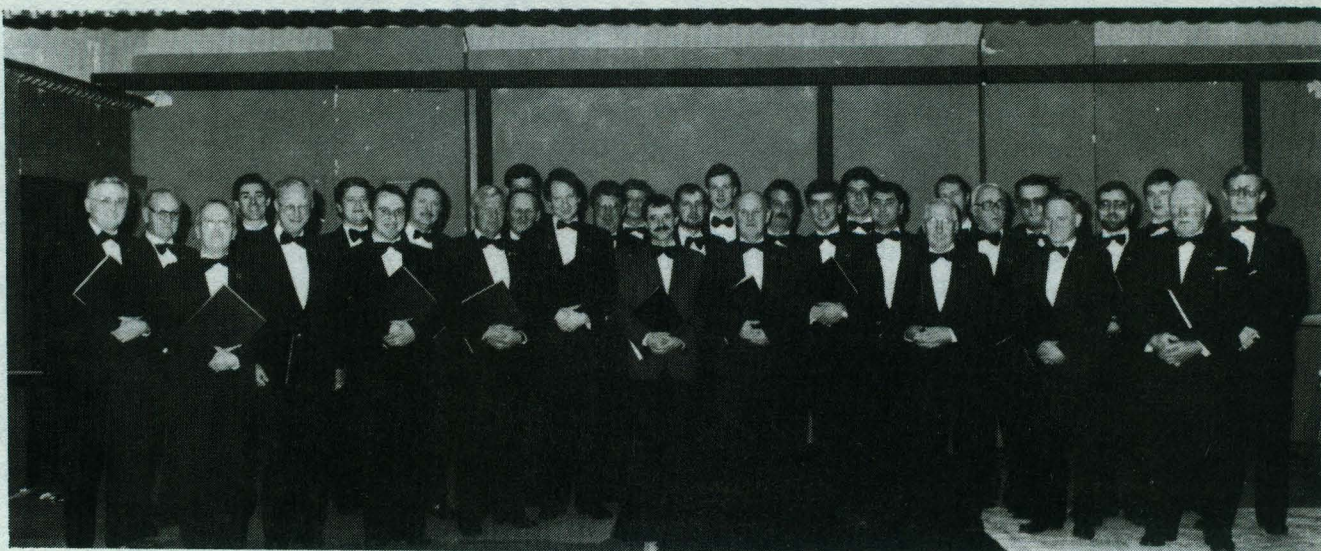
De Emelgemse Kerels anno 1987

TV-optredens, de herhaalde deelname aan het Vlaams Nationaal Zangfeest, de goede prestaties op de provinciale koortornooien waar het koor in eerste categorie geregeld een eerste prijs behaalde.